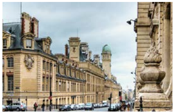
Universität Paris-Sorbonne (Paris IV)