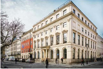
Das Deutsche Historische Institut in London