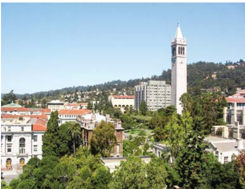
University of California, Berkeley